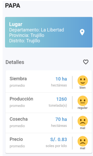
Ilustración 1: Búsqueda de producto