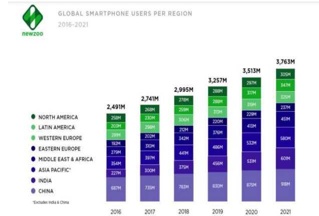
Figura 2. Uso del dispositivo móvil en el mundo [6]

Los dispositivos móviles han alcanzado gran demanda en el mercado pues brindan como su nombre lo indica movilidad, tal es el caso de muchos empleados que realizan actividades fuera de su oficina y necesitan acceder a bases de datos, compartir archivos y guardar información de una manera rápida y sencilla, siendo vital para su productividad laboral. El auge de teléfonos móviles en el mundo a finales de 2018 se estima de unos 3000 millones de usuarios [6], por lo que se puede afirmar que los últimos avances en los dispositivos móviles hacen que se conviertan en herramientas imprescindibles en la vida moderna [9].