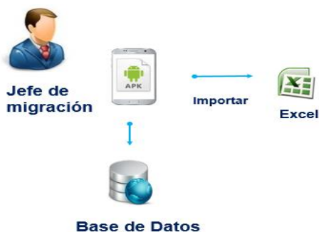
Figura 3. Proceso de Importar excel a la aplicación (Elaboración propia).

La (Figura 2) muestra un dispositivo móvil el cual tendrá instalado la aplicación y un archivo excel copiado previamente en la memoria del dispositivo, ya sea interna o externa. Es el jefe de migración quien realiza la acción de exportar el archivo almacenado en la base de datos de manera persistente.